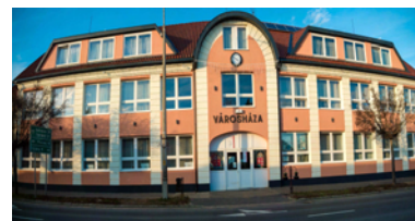
Létavértes Kossuth u. 4.

honlap: www.letavertes.hu - blog: http://letahirek.blog.hu - facebookon - Twitteren - e-mail: letahirek@gmail.com