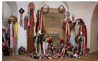
Széchenyi István halálának 160. évfordulója alkalmából