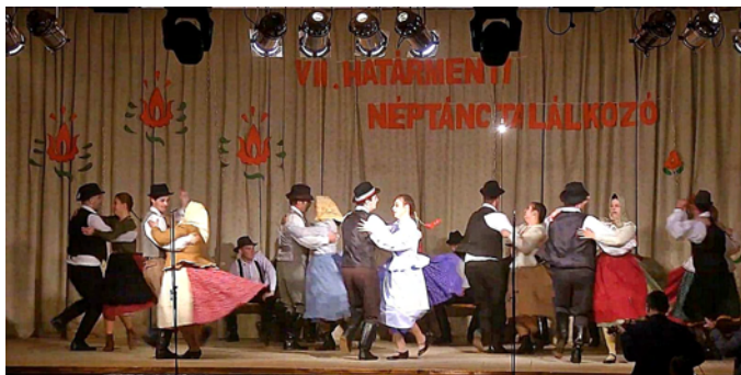
Színpadon a Villongó néptáncsoport

Majd így folytatta: táncra mindegyikünknek szüksége van, hiszen még így közvetett módon, nézőként is részesülhetünk jóteknő hatásából. Tudjuk, mert látjuk, hogy aki táncol, az boldog. Boldog mert tánc közben nem lehet szomorúnak lenni. A tánc olyan érzéseket, érzelmeket szabadít fel, melyeket pusztán szavakkal nem lehet kifejezni.